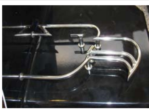
Gepäckträger Adlerkopf "Edelstahl"