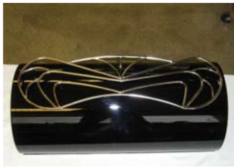
Kofferrolle "Magnum" mit Gepäckträger Edelstahl (Einzelfanfertigung)