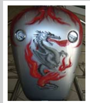
Tankattrappe mit Instrumente