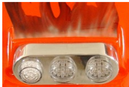
Rücklicht LED dreifach. Material Aluminium.