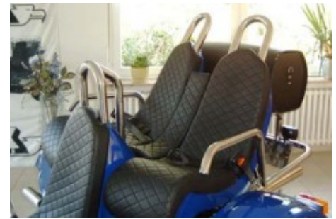
Kopfstütze "Dreierset" für Fahrer und Beifahrer. Material Edelstahl.