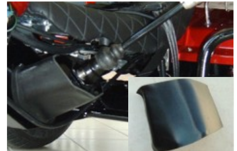
Schaltkulissenabdeckung und Ihre Schaltung hängt nicht mehr! Material Kunststoff.