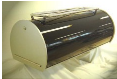
Kofferrolle "Magnum" Deckel mit gleichschließenden Zylindern. Material Kunststoff.