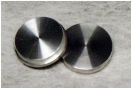
Verschlussdeckel für die Heizöffnungen am Gebälsegehäuse. Material Aluminium