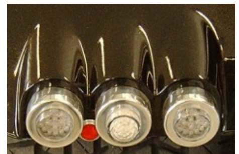
Rücklicht LED single. Lichter einzeln gefasst. Material Aluminium.