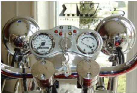
Instrumentencockpit mit passender Halterung. In verschiedenen Variationen.