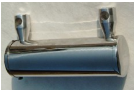
Werkzeugrolle mit Haltern. Material Edelstahl.