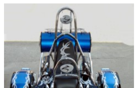
Verstellbare Kopfstütze. Für Fahrer und Beifahrer. Material Edelstahl.