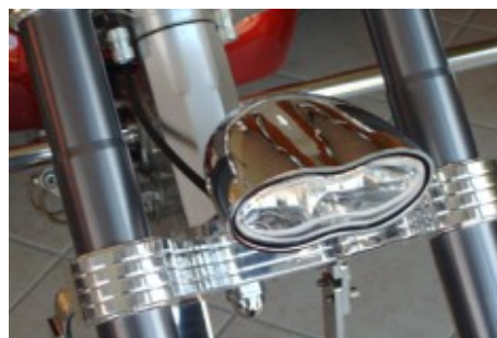
Doppelscheinwerfer mit Zusatz-, Fern- und Nebellicht.