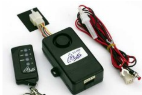
Alarmanlage mit Fernbedienung