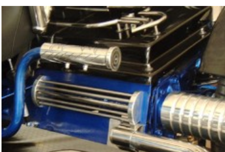
Zierblende für die Hinterachse. Material Aluminium und Edelstahl.