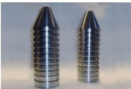
Protektoren für die Schräglenkerachse. Material Aluminium.