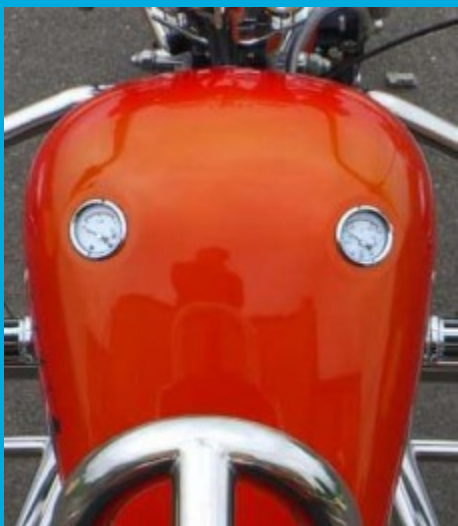
(Tankattrappe mit Instrumente)