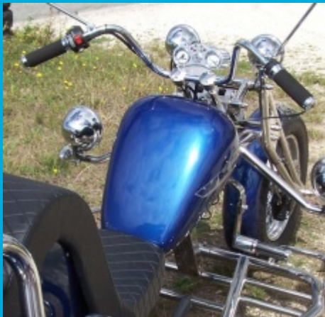
(Tankattrappe ohne Instrumente)