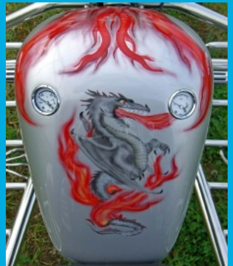
(...bestens für Airbrush geeignet)