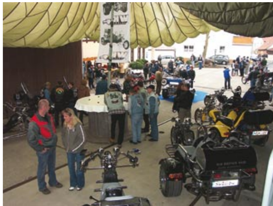
Wie immer gut „beschildert“ vor Regen, der Innenhof mit allen Dreirädern der aktuellen Serien.

Das „Neue“ steckt im Detail. Volksfest bei der WK-Hausmesse. Noch nie so viele Gäste in Aubstadt.