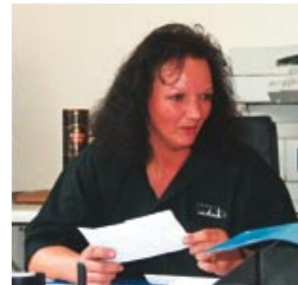
Die Hausmesse war eine gelungene Veranstaltung. Die WK-Crew und ihre Chefin hatten sich dafür alle Mühe gegeben.

Fahrersitz für den Dreisitzer angeboten, hinter dem ein Handschuhfach oder das Radio untergebracht werden kann. Der Rücksitz des Dreisitzers wird jetzt serienmäßig mit Klappvorrichtung geliefert. Das Tanken wird also deutlich bequemer. Innovation zeigt sich auch bei der neuen Rücklichtserie. Als Einzelanfertigung sind künftig Rücklichter aus polierten Aluminiumgehäusen zu haben. Als Einzellichter, Rücklicht, Bremslicht, Blinker oder als Kombination im Dreier-Set. Alle sind mit LEDs ausgestattet. Die Lebensdauer dieser kleinen LEDs liegt bei etwa 56.000 Stunden. Hierzu passend steht dem Kunden eine andere Kotflügelform zur Verfügung. Die neuen Rücklichter können aber auch auf die herkömmlichen Kotflügel mon-